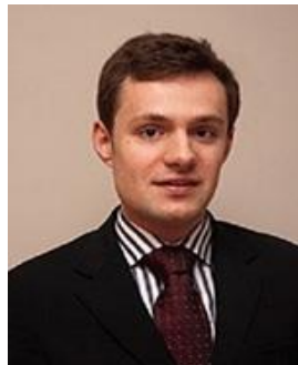
Till Campe Associate